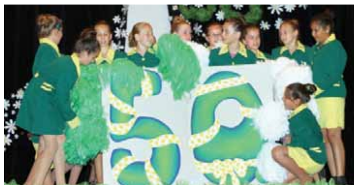
Kultúrny program pripravili deti a žiaci ZŠ s MŠ v Bohdanovciach