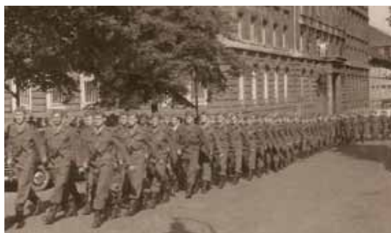
1. Československá brigáda pri OSN (v prvom rade v strede)