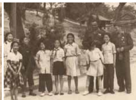
...stojaci druhý zprava