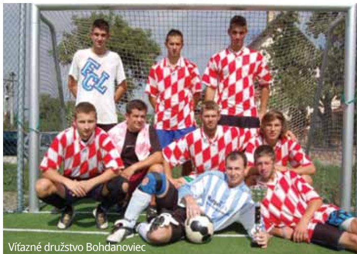
Vítazné družstvo Bohdanoviec