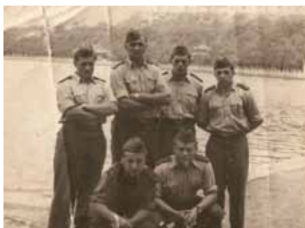
Na fotografii stojaci druhý zľava