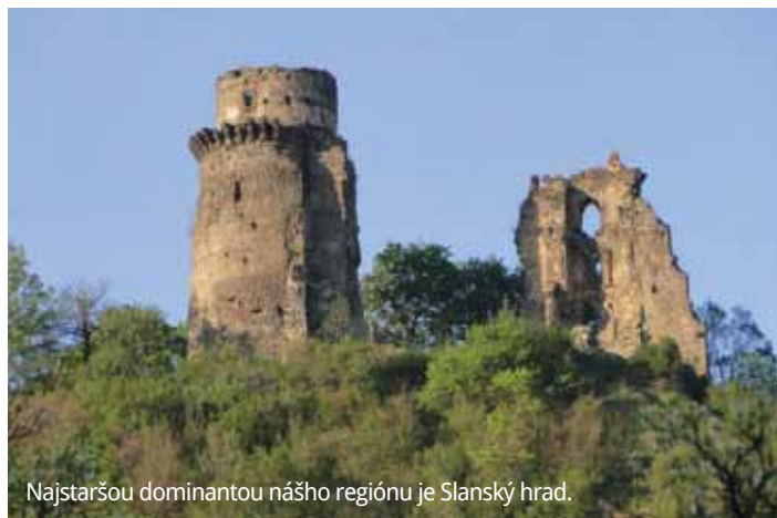
Najstaršou dominantou nášho regiónu je Slanský hrad.

Roku 1330 Szálanci Péter Comes vymenili hrad za šarišské obce s Viliamom Drugethom, ktorý od roku 1334 do roku 1342 bol palatínom Uhorska. Je vysoko pravdepodobné, že tak neučinili dobrovoľne, keďže po bitke pri Rozhanovciach v júni roku 1312 Abovcí stratili postupne vplyv a majetky. Viliam Drugeth pred odchodom na kráľovské ťaženie do Poľska zanechal testament datovaný 9. augusta 1330 (hoci zomrel až v roku 1342), v ktorom Hrad Slanec a ďalšie hrady zanechal svojmu bratovi Mikulášovi. Roku 1342 sa majiteľom hradu stal Mikuláš Drugeth, rišsky sudca a turocký hlavný íspán. Roku 1379 hrad patrí jeho právnučke Anne Drugethovej vydatej za Ladislava Telegdyho. Roku 1390 je majiteľkou hradu Anna Telegdy (vnučka Anny Drugethovej), vydatá za Ladislava Lossonczyho. Roku 1440 je majiteľom hradu Ján Lossonczy. Po tomto roku, keď v Uhorku prebiehali vnútorné boje medzi ovdovelou kráľovnou Alžbetou a Vladislavom I., je pravdepodobné, že Ján Jiskra z Brandýsa, český vojvodca, hrad obsadil a zničil. Roku 1490 za panovania Vladislava II. – vtedajší majiteľ hradu Ladislav Lossonczy, hlavný kráľovský pokladník, ho dal obnoviť. Roku 1520 za Žigmunda Lossonczyho (syna Ladislava), hrad mal kapitánov Jána a Andreja Doláni Černého. Roku 1552 boli pánmi hradu Anton a Štefan Lossonczyovci. Po